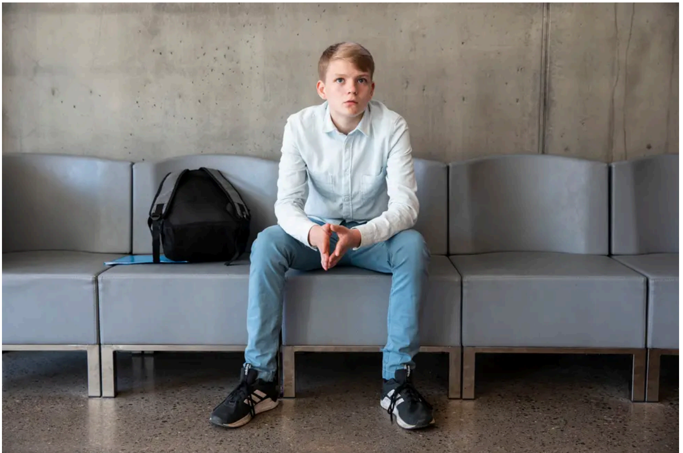
Han ble tvunget til å legge opp som 14-åring. Nå må barnestjernen bygge nye topper fra bunn.